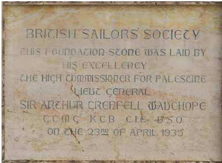
אבן הפינה של הבניין

העיתון "פלסטיין פוסט" תיאר ב-6.5.1938 בהרחבה את הפעילות שהתרחשה בבית בשנתיים הראשונות לקיומו, ובין השאר מסר כי המקום מציע מקלט ומקום מפגש חברתי למלחים מכל המדינות והלאומים. בשנה הראשונה לקיומו נערכו בו 300 מפגשים, ביניהם גם כמה קונצרטים של תזמורות מאוניות הוד מלכותו שעגנו בנמל. כן הוקמה ועדה של נשות הפקידים הבריטים הבכירים שגרו בחיפה, לארגון פעילות חברתית וגיוס תרומות לרכישת ריהוט וציוד נוסף. המוסד תמך גם בימאים שנקלעו למצוקה כספית, וטיפל בכ-84 מקרים של עזרה סוציאלית. מספר המפגשים הדתיים שהתקיימו בו היה 54, והשתתפו בהם 2,182 מאמינים. בסך הכל ניצלו את שירותי הבית כ-33,000 איש.