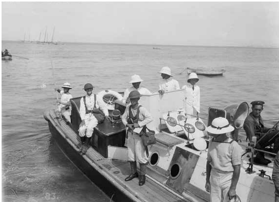
נחתים בריטים מסיירת בארהאם יורדים לחוף חיפה

באותו יום גם נרצחה בדקירות סכין מלכה אפרימוב בת ה-40. בעלה עבד כשומר בבית החרושת "שמן", והם התגוררו בצריף בחצר המפעל. מלכה נהגה לטייל בכל יום בין עצי הדקל שבשפך הקישון, ושם נרצחה. בשעות הצהריים החלו תושבים מהכפר הערבי טירה, שנקראו על ידי ערביי חיפה, לצעוד צפונה לאורך החוף לכיוון השכונה היהודית בת גלים. כוח בריטי בסיוע מטוס קרב פיזר אותם, לאחר שהרג אחד מהם ופצע אחרים. כ-40 מאנשי טירה נעצרו.