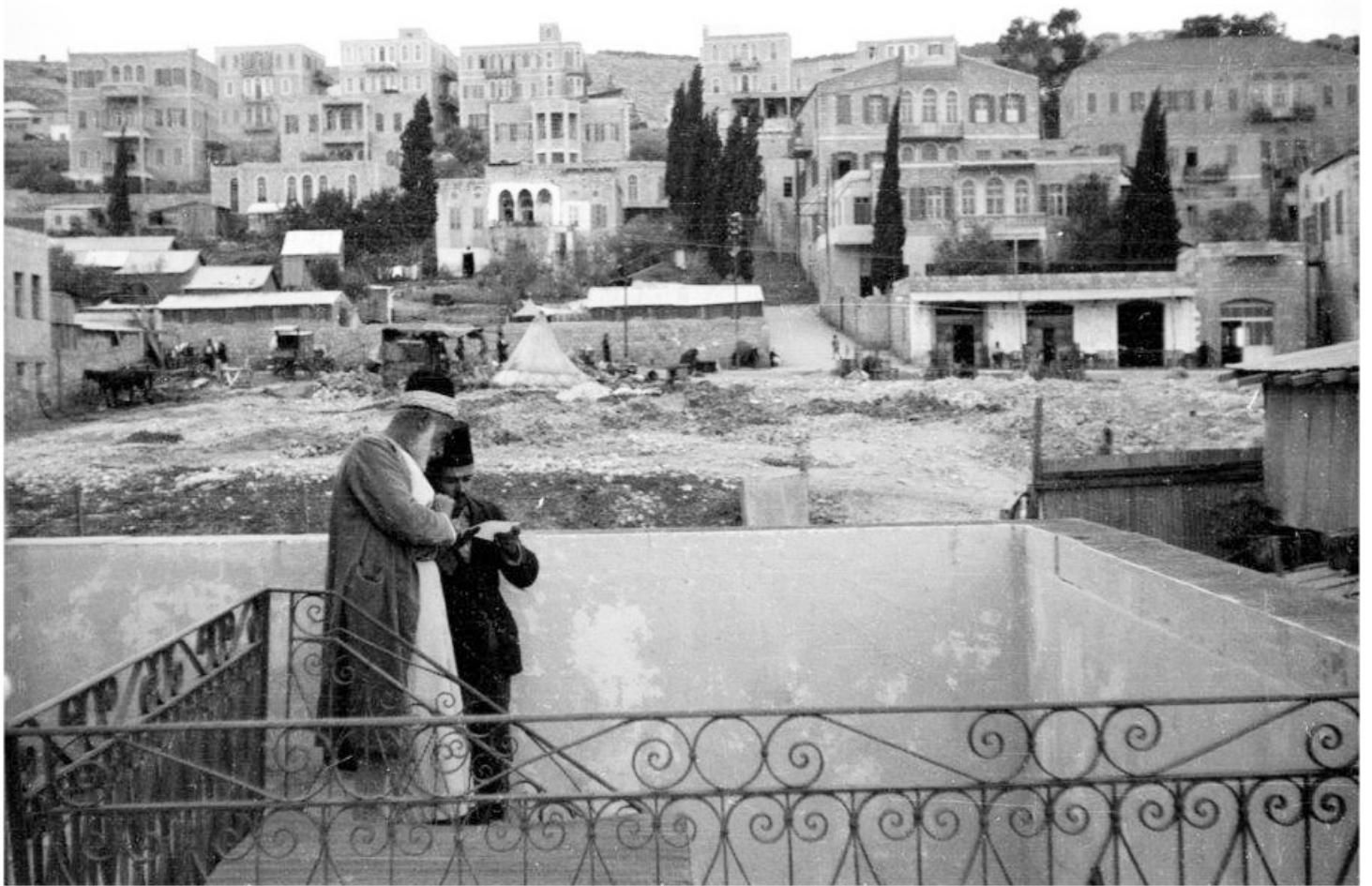
מבט אל ארד אל יהוד צילום: זאב אלסנדרוביץ, 1933 באדיבות משפחת אלסנדרוביץ