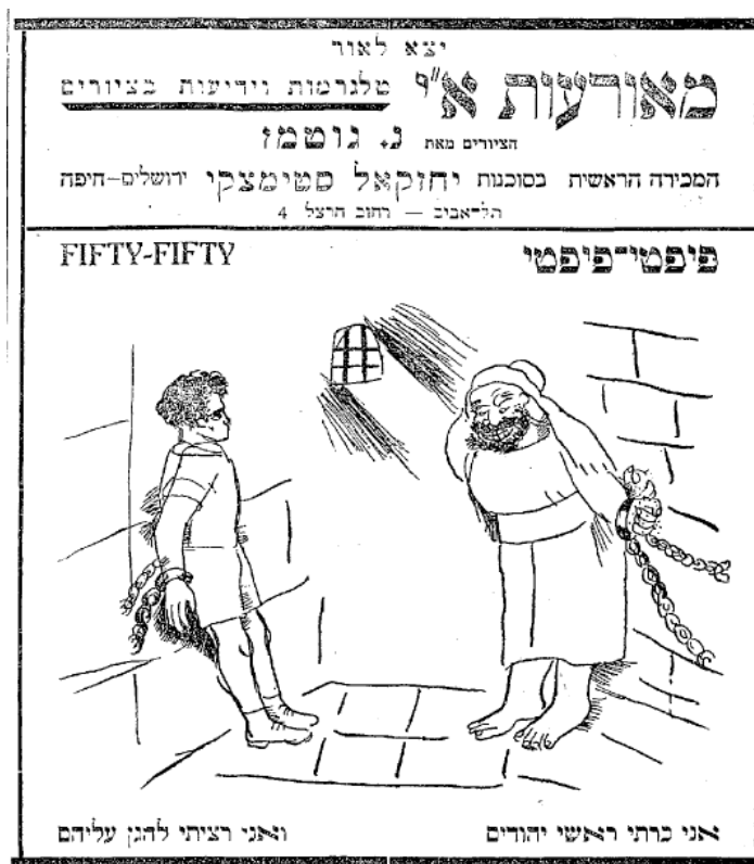
דבר 24.9.1929. ציורים: נחום גוטמן, באדיבות מוזיאון נחום גוטמן לאמנות.