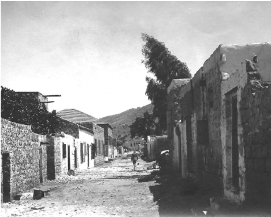
בתי השכונה

בתי השכונה הצפופה נבנו מאבנים שנלקחו ממחצבות וואדי רושמייה, והיו בני קומה אחת, שניים או שלושה חדרים ומרפסת. חלל תת-קרקעי שימש כמרתף לשימור מצרכים בקיץ. המים נשאבו מבארות, עד שב-1926 חוברו בתי השכונה לצנרת מים. תאורת חשמל הותקנה ברחובות אחרי מאורעות 1929, וביוב מרכזי נבנה רק בשנים 1935-1936. שמות שני הרחובות המרכזיים - רבי יהודה הלוי ואבן גבירול - נקבעו על ידי העירייה כאות כבוד למייסדי השכונה הספרדים.