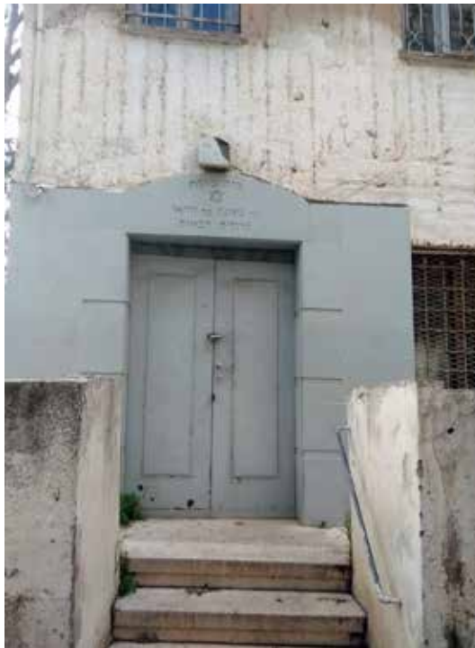
בית כנסת הרשב"י.

בשל התמעטות מספרם פנו הנשארים בשכונה אל המוסדות העבריים בקול קורא, שבו התריעו על מצבם ומצב השכונה וביקשו סיוע. את מכתבם סיימו במילים "... בידכם אחים תלוי הדבר ורק בעזרתכם נוכל לצעוד קדימה ...". גם זונות החלו לקבל לקוחות בשכונה, וב-13.5.1919 כתבו כמה משפחות לוועד העדה העברית (הגוף שנקרא מ-1927 בשם ועד הקהילה העברית): "... אנו החתומים מטה תושבי המושבה 'הדר הכרמל' הידועה בשם 'ארד אל יהוד' ... מבקשים את כ' להואיל לעשות את הצעדים הדרושים בפני הממשלה המקומית ... בכדי להוציא את הנשים הפרוצות שגרות בקרב שכונתנו. לא נעלם מכל על הסכנה הגדולה הבאה מנשים אלה לנו ולמשפחתנו. מלבד זה הרבה אנשי צבא וגם אנשים שכורים מבקרים את המקומות הללו ומעיזים גם לבוא, לפעמים, לבתינו לגלוש מריבות וקטטות שכמו יכולות להביא לידי תוצאות מרות. נא להאיץ בעניין זה לכבוד העדה העברית החיפאית בכלל ולכבוד נשינו ובנותינו בפרט ...". אך הפנייה לוועד העדה העברית לא פתרה את הבעיה ונראה שהוגשה גם תלונה רשמית, שכן העיתון "דאר היום" דיווח ב-20.4.1920 כי "... בית המשפט הממשלתי המקומי פקד להוציא את כל הנשים המשחתות בשכונת 'ארד אל יהוד'. כדאי לוועד העיר להשתמש מכאן ואילך באמצעים חזקים למנוע את 'יהודינו' מלהשכיר את דירותיהם לבתי בושת ...".