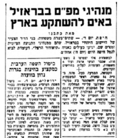
על המשמר. 28.5.1964

קישור לסרט: https://youtu.be/hsLEyDKQ-JU