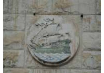
מדליונים על קיר הבניין, מעל הקשתות

ראוי לציין כי בפתח הבניין - מימין לקשתות הכניסה - משובצת עד היום אבן הפינה המקורית ראו בצילום.