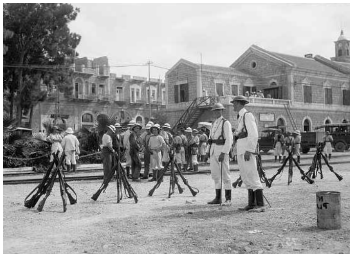
נחתים בריטים ליד תחנת הרכבת בחיפה