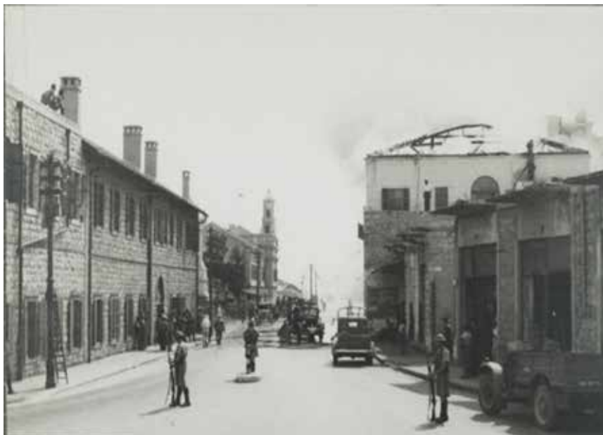
חיילי הגדוד מאבטחים אתר שריפה