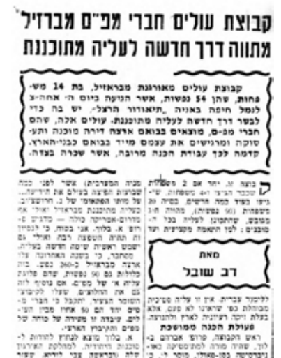
על המשמר. 31.5.1964