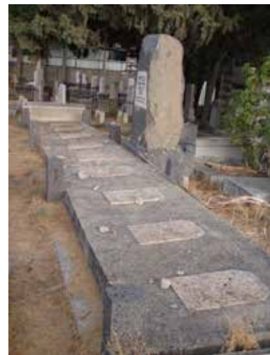
קבר אחים לקדושי המאורעות