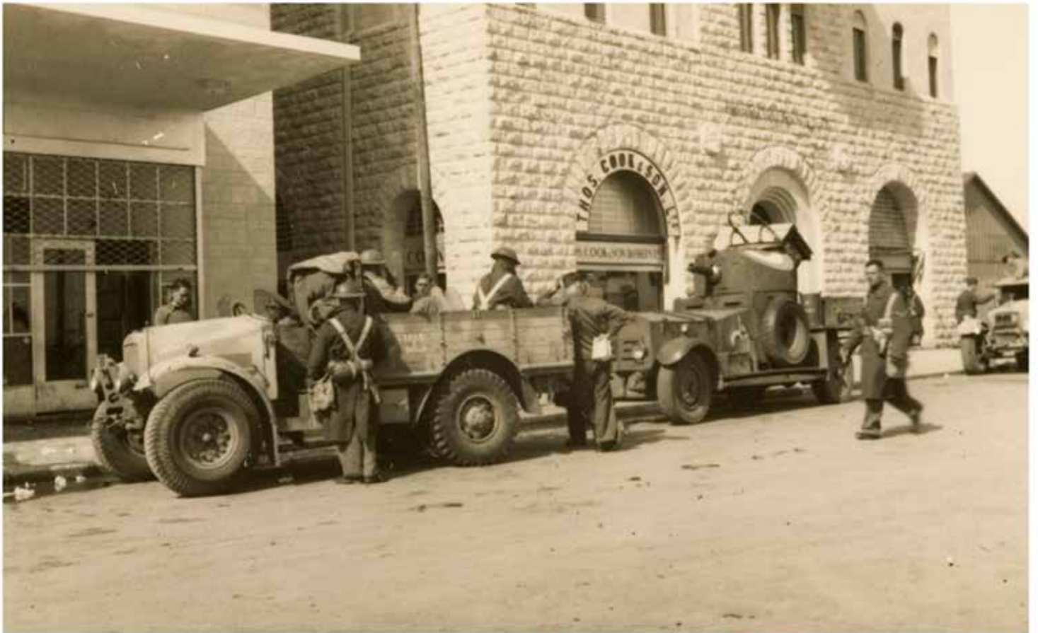
סיור ממונע בחיפה, מלווה על ידי שריונית של חיל האוויר המלכותי, יוצא מבית יורדי הים (על הפעילות בבית יורדי הים ראו במאמרו של יעקב שורר בגיליון זה)