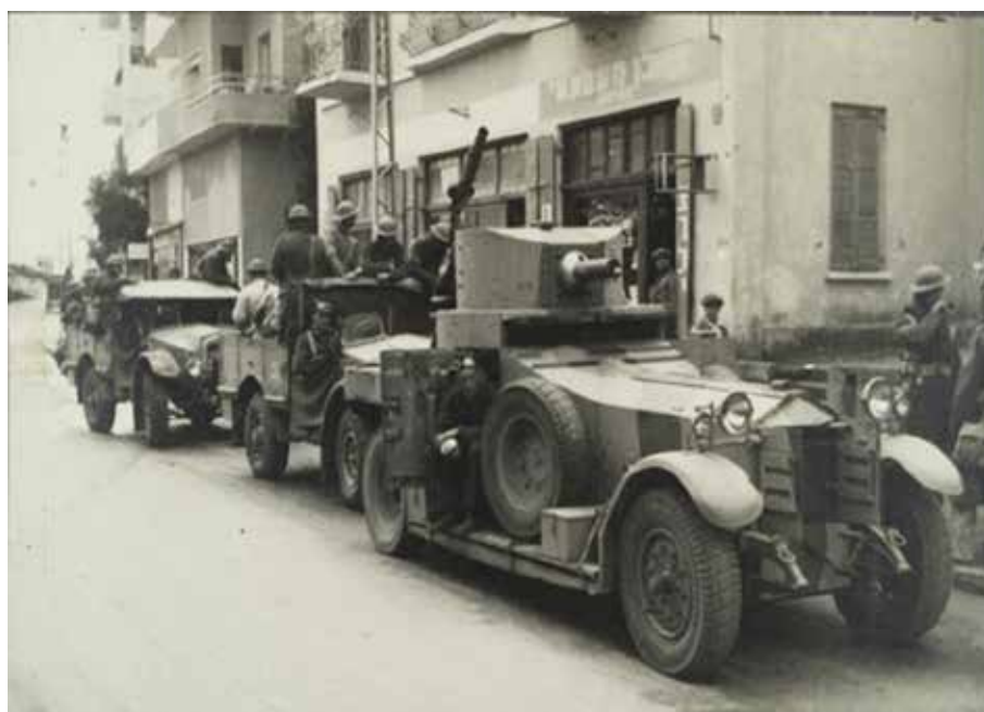
סיור ממונע בחיפה מלווה על ידי שריונית של חיל האוויר המלכותי

שגרת הפעילות בגדוד התבססה על סבב בין הפלוגות. כל פלוגה שהתה שבועיים בחיפה ושבועיים במוצבי החוץ, כשבמהלך שהותה בחיפה היא ביצעה את משימת HAICOL לצד משימות שמירה ואבטחה בעיר ובסביבתה. בשבועיים הבאים פוצלה הפלוגה למחלקות, שנשלחו למוצבים ביישובים השונים. בשל אילוצים שגרם עומס המשימות פוצלו לעתים הפלוגות כך שהסבב התבצע גם בתוכן, כלומר שתי מחלקות שהו במשימות מחוץ לחיפה ושתיים נותרו בבסיס האם. מפקדת הגדוד, פלוגת המפקדה ומחלקת הרכבת שהו בחיפה באופן קבוע, ומשם יצאו למשימות השונות.