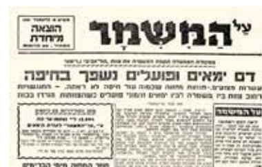
על המשמר, דצמבר 1951

גם ההסכם שהביא לסיום השביתה נחתם בבית יורדי ים. בדצמבר 1951, שבוע אחרי מה שנודע כ"יום שישי השחור". נציגי הצדדים התכנסו בבית וסיכמו על הפסקת השביתה, על החזרת כל הימאים לעבודתם ועל פעולה של ההסתדרות לשחרור הימאים שגויסו לצה"ל. כן הוסכם שכל הנושאים הארגוניים של איגוד הימאים ייבדקו על ידי מועצת ההסתדרות הקרובה.