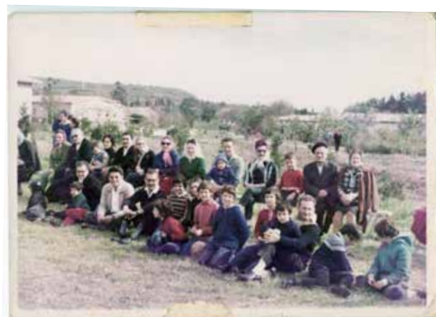
תמונות מהווי הקומונה