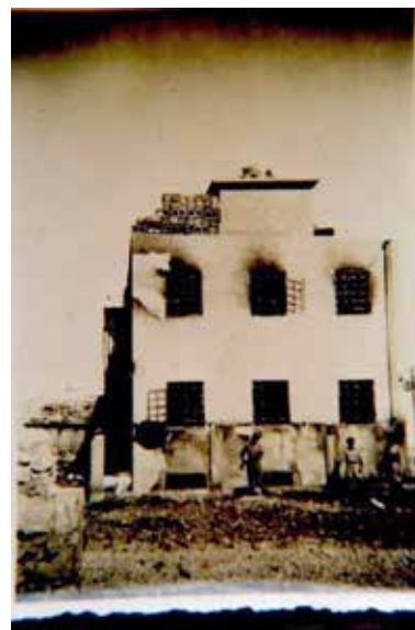
בתים שנשרפו במאורעות

במאורעות 1929 תקפו ערבים את היהודים ברחבי העיר התחתית, ושדדו מכל הבא ליד. כתוצאה מכך נטשו חלק גדול מיהודי השכונות המערבות את בתיהם, ומספר הפליטים היהודים הוערך ב-3,000. תושבי השכונות שנפגעו הקימו את "הוועד לנגועי הפרעות בחיפה" כדי לייצגם בפני מוסדות הקהילה העברית. דרישתם העיקרית הייתה פיצוי על הנזקים והשבת המצב בשכונות לקדמותו. רבים ממי שנטשו את בתיהם לא שבו להתגורר בהם גם בתום המאורעות, אך המוסדות הקהילתיים שפעלו בשכונות, כמו בתי הכנסת (בשבתות) ותחנות טיפת חלב, המשיכו לפעול והמשתמשים בהן באו במיוחד לשכונה. הנטישה היהודית וכניסת ערבים לבתים הריקים הביאו לירידת ערך המבנים, שהפכו עם הזמן לבתי מלאכה וחנויות שבעליהם אינם תושבי השכונה. היהודים שנשארו בארד אל יהוד הפכו למיעוט בה.