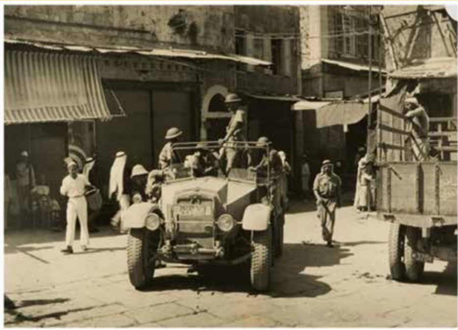
סיור ממונע בעיר