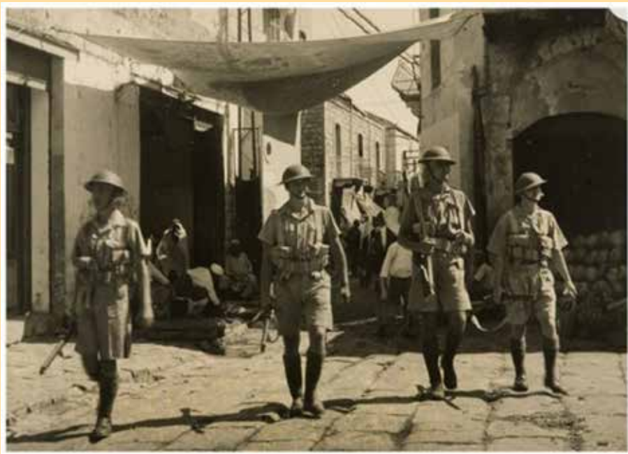
סיור רגלי בסימטאות העיר