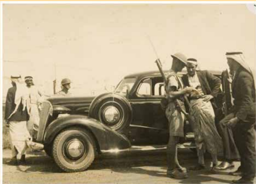
חיפוש בכלי רכב